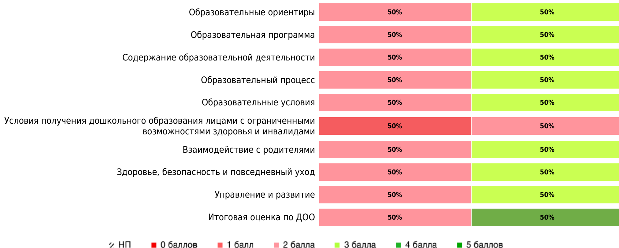
Доли ДОО с разными баллами у педагогов